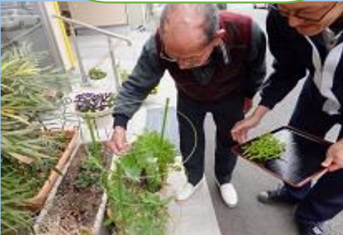
育てた野菜を摘み取る