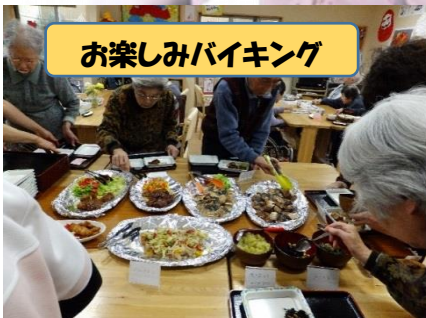
お楽しみバイキング