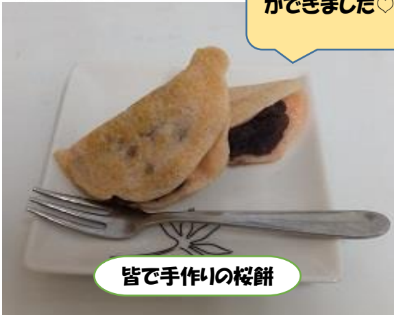
皆で手作りの桜餅