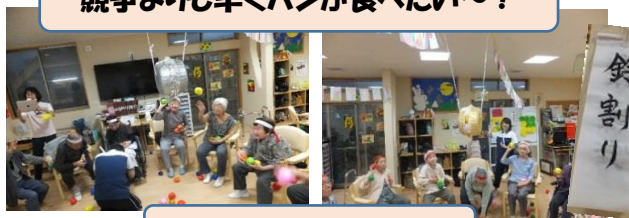
さあ！当てて当てて！