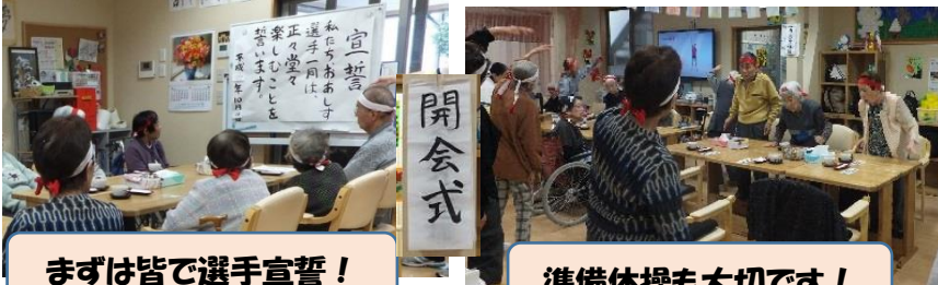
まずは皆で選手宣誓！