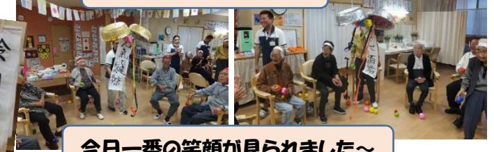
今日一番の笑顔が見られました～