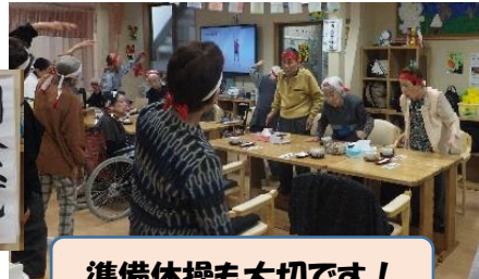
準備体操も大切です！