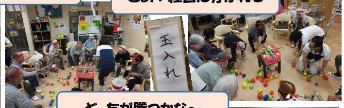
どっちが勝つかな～