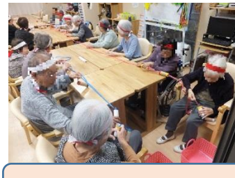
さあ！紅白に分かれて