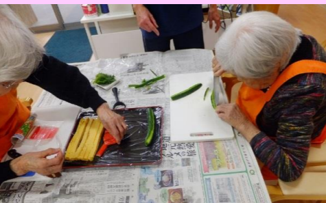
お米が炊けるまで下ごしらえ～