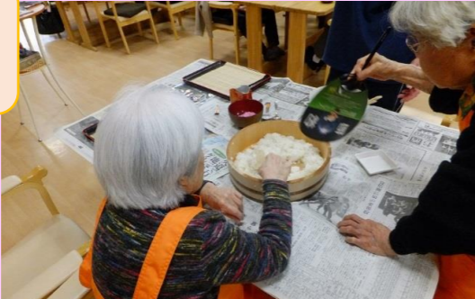
合わせ酢を混ぜたらあおいであおいで～