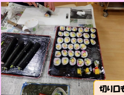
切り口も鮮やかに美味しそうに出来ました♪