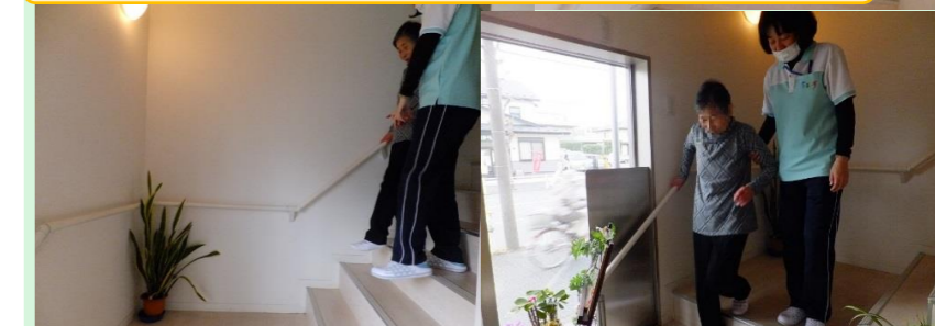
階段の登り降りは筋力アップトレーニングとしても最適です！