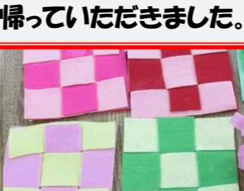
フェルトのコースター