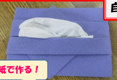
ポケットティッシュ入れ