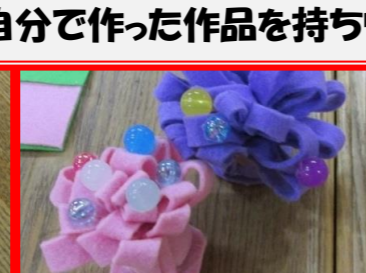
フェルトのコサージュ