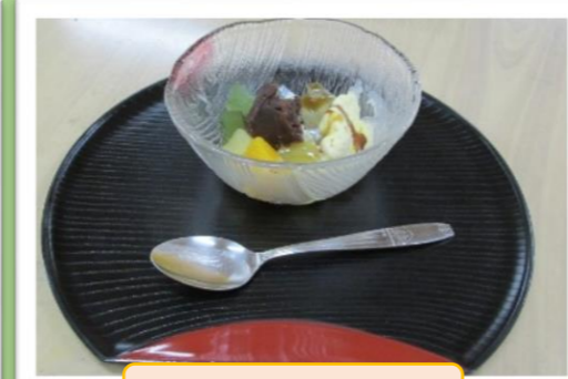
フルーツあんみつ