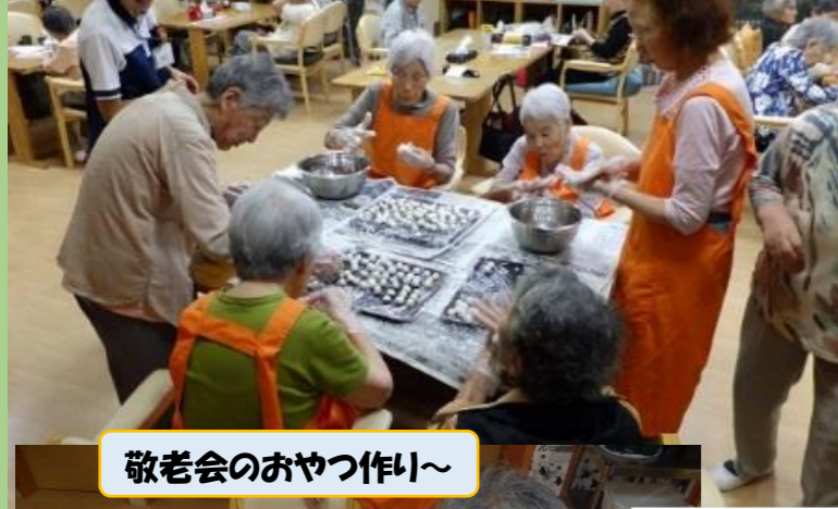
敬老会のおやつ作り～