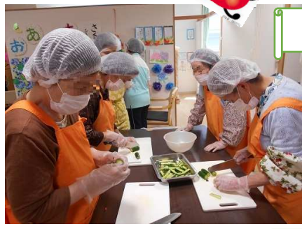
バーニャカウダー風サラダ