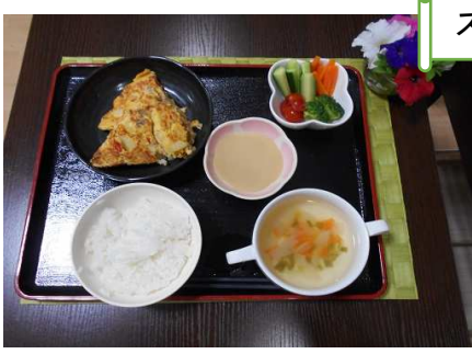
スペインオムレツ