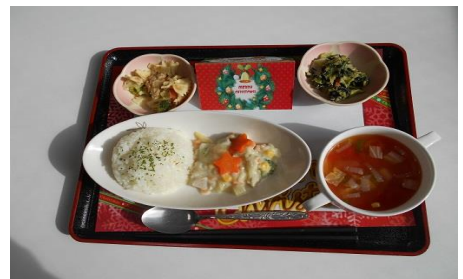
クリスマスカード付の特別メニュー