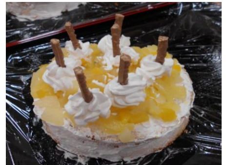
手作りクリスマスケーキ